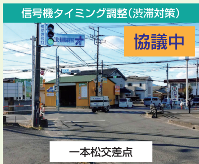
信号機タイミング調整(渋滞対策) 協議中 一本松交差点 地域の皆様からのご要望です。