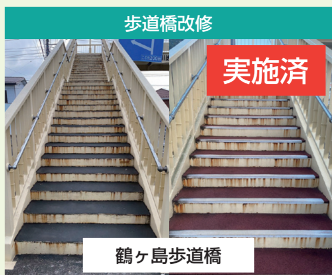
歩道橋改修 実施済 鶴ヶ島歩道橋 地域の皆様からのご要望です。