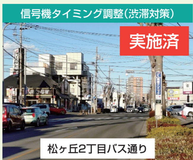
信号機タイミング調整(渋滞対策) 実施済 松ヶ丘2丁目バス通り 地域の皆様からのご要望です。