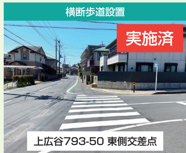
横断歩道設置 実施済 上広谷793-50 東側交差点 市議会議員様を通じてのご要望です。