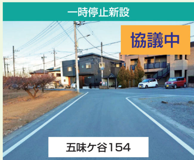
一時停止新設 協議中 五味ヶ谷154 地元自治会・地域の皆様からのご要望です。