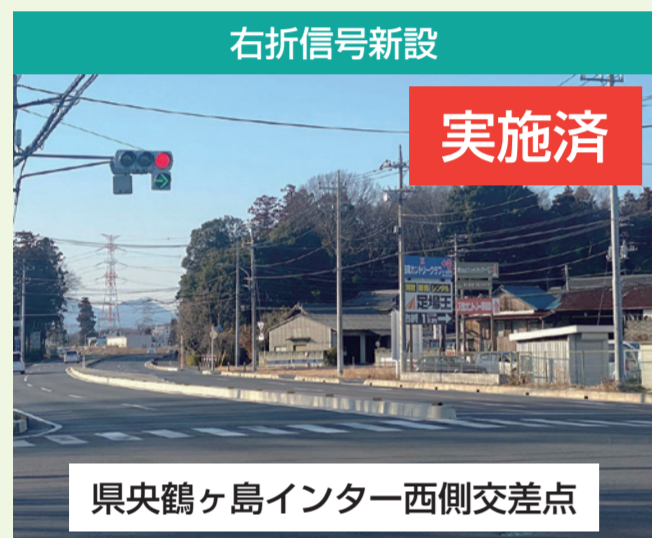
右折信号新設 実施済 県央鶴ヶ島インター西側交差点 市議会議員様を通じてのご要望です。