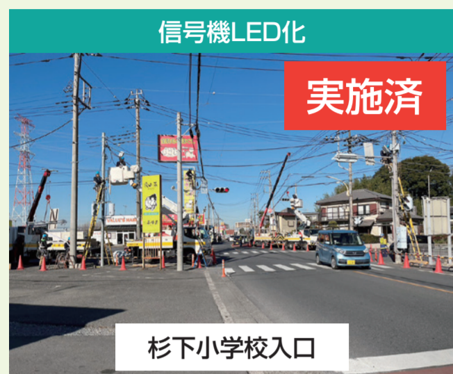
信号機LED化 実施済 杉下小学校入口 スクールガードの皆様からのご要望です。

地元の皆様からご要望をいただき取り組んでまいりました鶴ヶ島市内の交通安全及び渋滞緩和対策の進捗状況です。市内の交通危険箇所等はまだまだたくさんあります。引き続き1か所ずつ丁寧に対策を講じていく所存です。