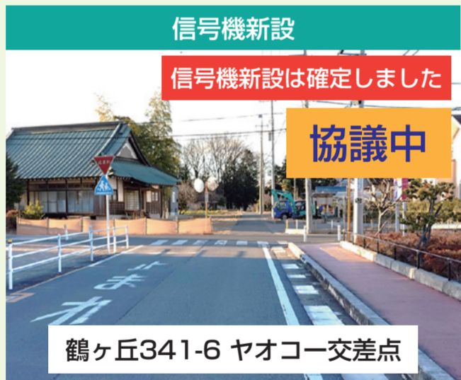
信号機新設 信号機新設は確定しました 協議中 鶴ヶ島市役所・地域の皆様からのご要望です。