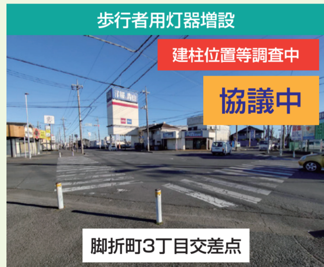
歩行者用灯器増設 建柱位置等調査中 協議中 脚折町3丁目交差点 市議会議員様を通じてのご要望です。