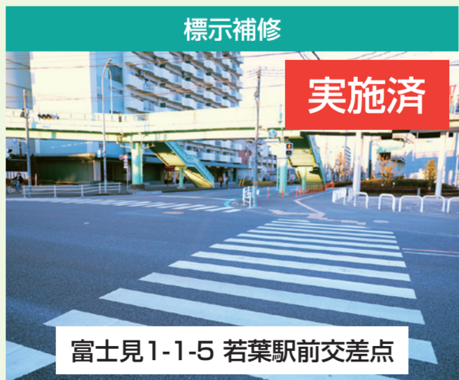
標示補修 実施済 富士見1-1-5 若葉駅前交差点 地域の皆様からのご要望です。