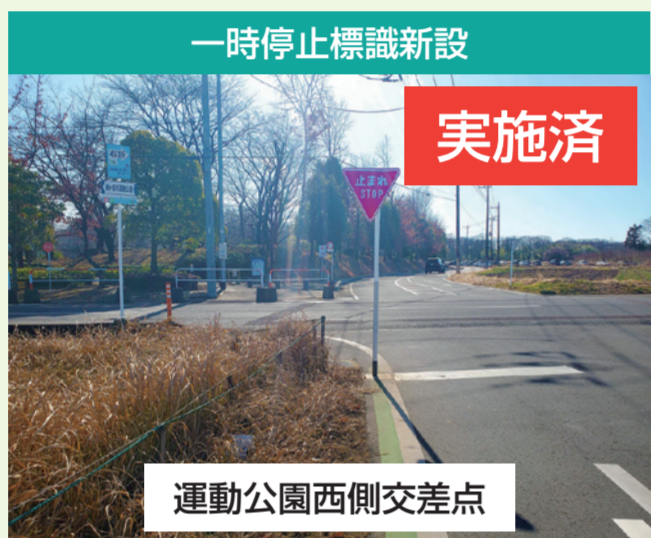
一時停止標識新設 実施済 運動公園西側交差点 市議会議員様、地元自治会からのご要望です。