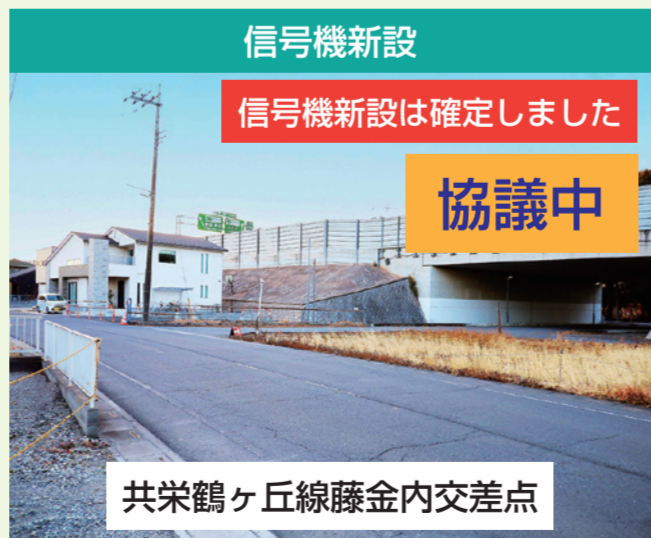
信号機新設 信号機新設は確定しました 協議中 共栄鶴ヶ丘線藤金内交差点 鶴ヶ島市役所からのご要望です。